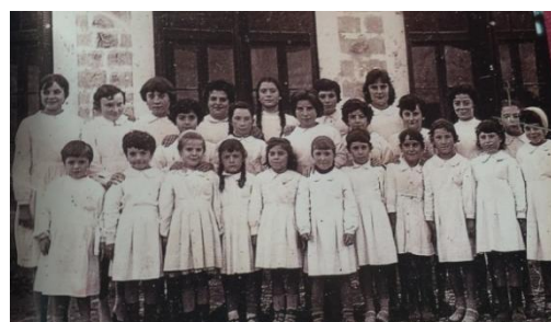
4. Irudia: Mutilen eta nesken geletako kideak

Irakasteko hizkuntza gaztelania izan arren, nesken maistra, adibidez, euskalduna zen eta ikasleren batek zerbait erantzuteko zailtasunak izaten bazituen,