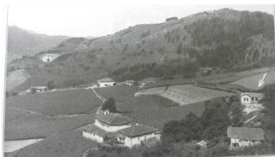
1. Irudia: Santa Luciaren kokapena