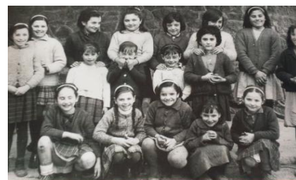
6. Irudia: nesken taldea

Garai honetan ere aurreko garaietako gauza asko mantentzen ziren: adin tarte berdinetan ikasten zen, gaztelaniaz, eta neskak eta mutilak banatuta jarraitzen zuten, adin desberdinetakoak biltzen ziren geletan; sarreretan “Cara al Sol” abesten jarraitzen zen; materiala eta ikasgaiak ere berdinak izaten jarraitzen zuten, neskatoek josten eta janaria prestatzen ere ikasten zuten (Ikus 6. Irudia).